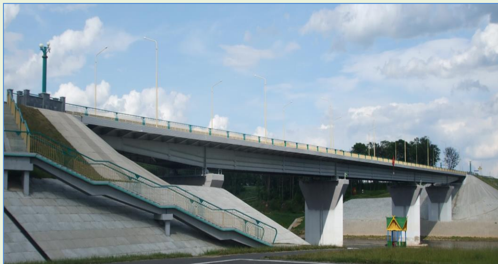
Мост через реку Западная Двина, соединяющий Верхнедвинский и Миорский районы

Площадь Узмёнского сельсовета составляет 14286 га, граничит с Повятским, Турковским, Миорским сельсоветами и Верхнедвинским районом.